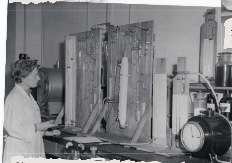
Zakład Chemii – badania aparatury do analizy ciągłej powietrza metodą chromatografii gazowej. J. Rousseau. Rok 1961