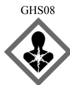
Rys. 1. Kody hasła ostrzegawczego: „Uwaga”. Piktogramy określone w rozporządzeniu WE nr 1272/2008 (CLP) mają czarny symbol na białym tle z czerwonym obramowaniem, na tyle szerokim, aby było wyraźnie widoczne