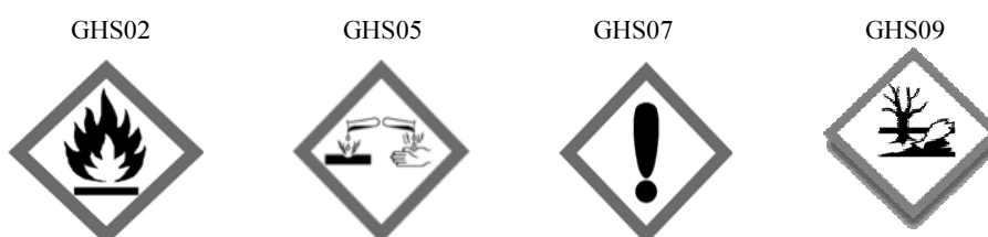
Rys. 1. Kody hasła ostrzegawczego: Dgr („Danger” – „Niebezpieczeństwo”). Piktogramy określone w rozporządzeniu WE nr 1272/2008 (CLP) mają czarny symbol na białym tle z czerwonym obramowaniem, na tyle szerokim, aby było wyraźnie widoczne

**** – niemożliwe było ustalenie poprawnej klasyfikacji zagrożeń fizycznych.