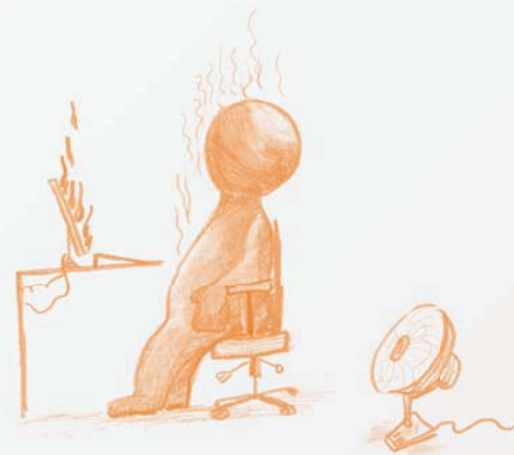
Wysoka temperatura obniża skuteczność pracy w biurze High temperature reduces the work efficiency in the office

Wyon i Wargocki [11] twierdzą, że efektywność pracowników wykonujących określone zadania wzrasta wraz ze stopniem aklimatyzacji do warunków środowiska, w którym przebywają. Według badań Chen i Chang [12] pracownicy biurowi z Singapuru, miasta, w którym temperatura zewnętrzna powietrza zmienia się w ciągu roku od 23 do 34 °C, odczuwają komfort termiczny w pomieszczeniach o temperaturze 27 °C, a nie jak można byłoby przypuszczać w miejscach chłodniejszych. Jeszcze wyższe preferencje termiczne zadeklarowali pracownicy fabryk z tropikalnej Sri Lanki, dla których optymalna temperatura w miejscu