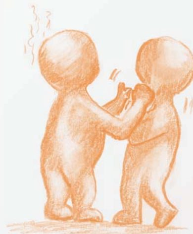
Wysoka temperatura nasila agresję międzyludzką High temperature enhances interpersonal aggression