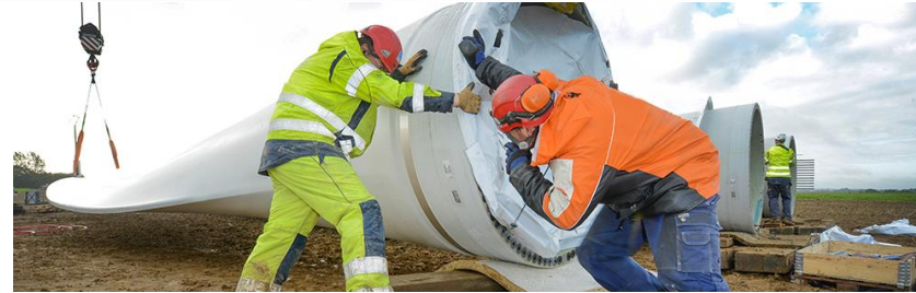
„Zielone miejsca pracy”

Badanie ESENER-2 pokazało, że potrzebna jest jasna informacja o znaczeniu oceny zagrożeń, narażenia i ryzyka oraz środków zapobiegawczych w odniesieniu do wszystkich niebezpiecznych substancji obecnych w miejscu pracy