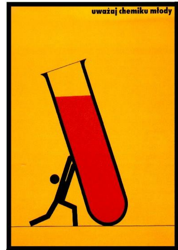
Plakat nagrodzony w Konkursie na Plakat Bezpieczeństwa Pracy Autor: Slavomir Uličný, 1999 r.